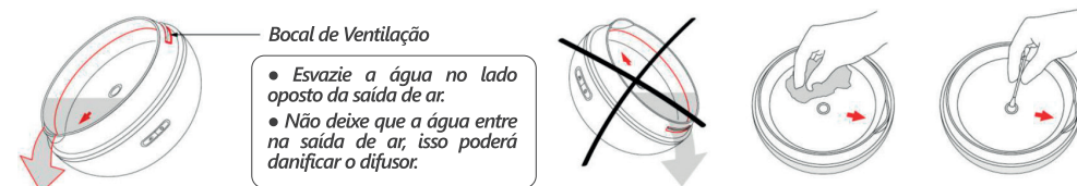
Bocal de Ventilação